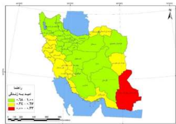
شکل - ۲: شاخص امید به زندگی استان‌های ایران