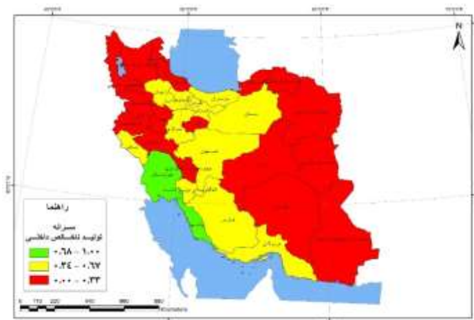
شکل ۱: شاخص تولید ناخالص داخلی استان‌های ایران

رابطه بین میزان زوداشتغالی و سطح توسعه انسانی استان‌ها براساس ضریب همبستگی منفی (۰/۴۰۲) نشان از رابطه معکوس با سطح معناداری کمتر از ۰/۰۵ دارد. در سطح شاخص‌های سه‌گانه، بین اشتغال زودرس با سرانه تولید ناخالص داخلی با ضریب (۰/۳۴۹-) و سواد (۰/۳۴۵-) رابطه مشابهی وجود دارد، ولی بین زوداشتغالی با امید به زندگی (۰/۳۱-) در سطح معناداری ۰/۰۸ با اطمینان ۹۲ درصد رابطه نسبتاً ضعیفی برقرار شده است؛ بنابراین عوامل دیگری بر شاخص امید به زندگی مؤثر است که منطبق بر اشتغال زودرس نیست؛ بر این مبنای اشتغال زودرس تا حدی بر امید به زندگی تأثیر داشته است.