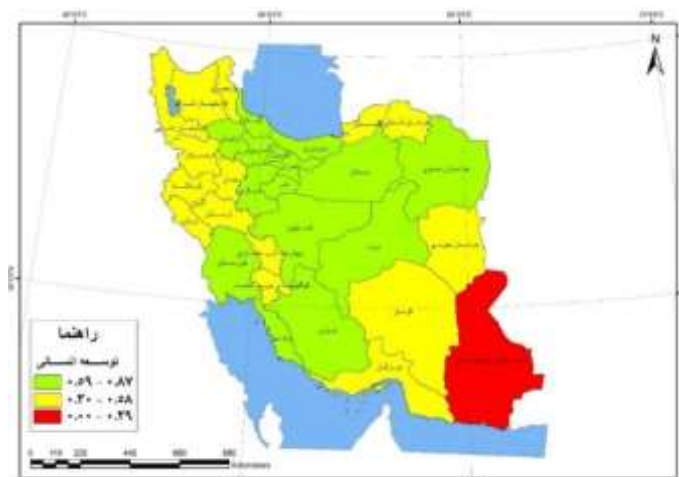
شکل - ۴: شاخص توسعه انسانی استان‌های ایران