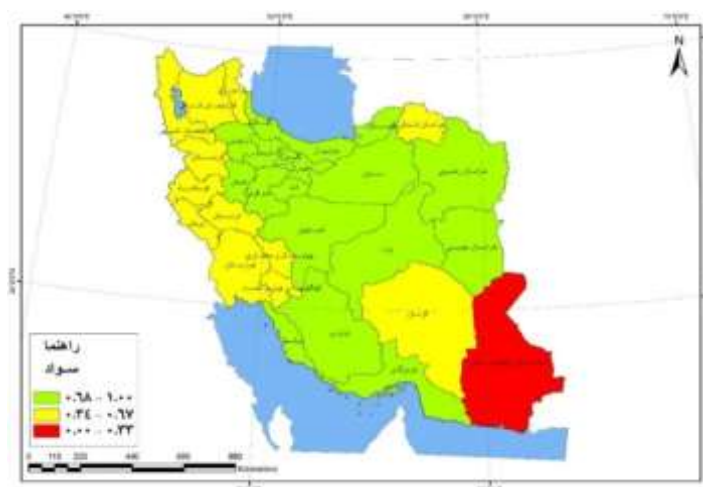
شکل - ۳: شاخص سواد استان‌های ایران

براساس شکل ۲ شاخص امید به زندگی در استان‌های البرز و تهران و بخش عمده‌ای از مناطق مرکزی، شمال و شمال غربی در سطح بالا و فقط استان سیستان و بلوچستان در پایین‌ترین سطح قرار دارد. سایر استان‌ها، بیشتر در مناطق مرزی شمال شرق، جنوب و غرب کشور در گروه متوسط هستند.