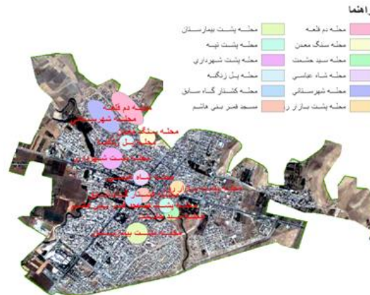
شکل ۲: پراکندگی جغرافیایی بافت فرسوده در سطح شهر اسلام‌آبادغرب

باعث اختلال در قدرت تصمیم‌گیری ساکنان بلوک-های فرسوده و امر نوسازی آن می‌شود. بعد خانوار در سطح محلات هدف ۴/۲۵ نفر است که با توجه به ریزدانی بلوک‌ها و پایین بودن کیفیت زندگی در سطح این محلات و همچنین عدم تمایل ساکنان به زندگی آپارتمان نشینی، بعدی قابل توجه است. در ضمن، عدم اعتماد به سازمان‌های مسئول شهری، همبستگی و محافظه‌کاری در برابر گروه‌های دیگر در میان ساکنان محلات، نبود تحصیلات مناسب، کیفیت نامناسب محلات از لحاظ دسترسی به مکان‌های فرهنگی و آموزشی، عدم وجود نهادهای اطلاع‌رسانی در زمینه‌های ساماندهی و بهسازی، نداشتن امکانات فراغتی و تفریحی باعث احاطه ایستایی فکری یا عدم وجود یک محیط باز فرهنگی یا به عبارتی، فرسودگی فکری و فرهنگی میان ساکنان بافت در زمینه‌های مختلف از جمله امر نوسازی می‌شود. جدول ۵ با استفاده از ضریب همبستگی پیرسن رابطه شاخص فرسودگی با متغیرهای مختلف اقتصادی، فرهنگی، اجتماعی و مدیریتی را نشان می‌دهد.