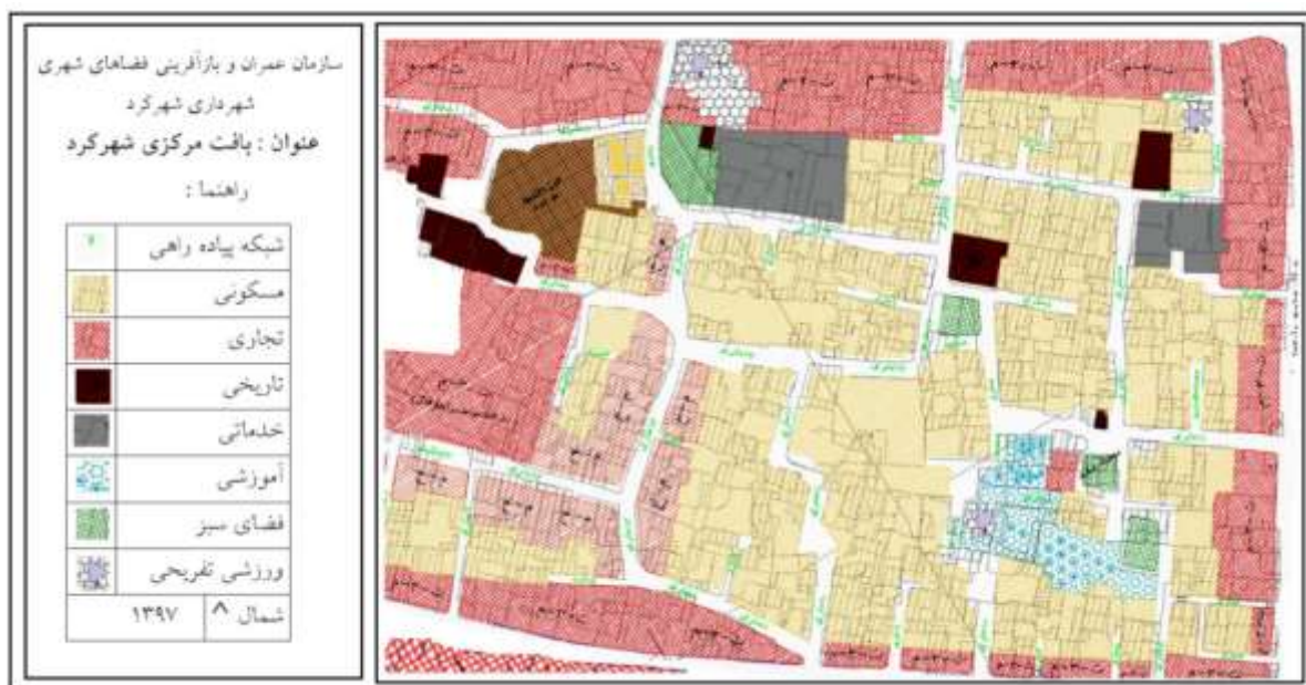
شکل - ۲: موقعیت شبکه پیاده‌راهی در بافت مرکزی شهرکرد

محدوده مطالعاتی با مساحت تقریبی ۲۰ هکتار در بخش مرکزی و در محدوده بافت فرسوده شهرکرد واقع شده است و به لحاظ ساختاری از الگوی ارگانیک واحدی در ارتباط با بافت مسکونی موجود پیروی می‌کند. توسعه معابر شهری در این محدوده براساس سیاست‌های بازسازی و نوسازی و حمایت از خودرو شکل گرفته است و فقط در شرایطی خاص عرض کم معابر مانع از تردد خودروها می‌شود. عملکرد مسیره‌های موجود براساس عرض آنها در حد جمع و پخش‌کننده است. کاربری زمین بیشتر مسکونی و با توزیع پراکنده خدمات تجاری محلی همراه است. در بیشتر مواقع مراکز خدماتی و تجاری در مقیاس فرامحله‌ای و عملکردهای شهری در حاشیه بافت قرار گرفته‌اند؛ از این رو عرصه فعالیت‌های سرزنده عمومی و تعاملات اجتماعی جز در شرایطی خاص صرفاً به نواحی خارج از مرکز محدود شده است. شکل (۲) موقعیت شبکه پیاده‌راهی را در بافت مرکزی شهرکرد نمایش می‌دهد.