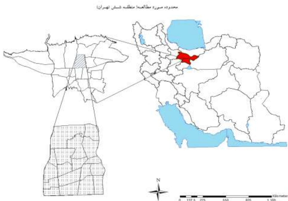
نقشه - ۲: محدوده مطالعه شده

معادل درصد مساحت شهر تهران، یکی از مهم‌ترین مناطق شهر تهران و جایگاه بالایی در تحولات شهری تهران داشته است و دارد (اژنگ، ۱۳۹۰؛ ۶۹).