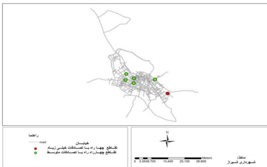
نقشه شماره ۳- توزیع فضایی تصادفات در تقاطع و چهار راه‌ها بر حسب تعداد

حوادث ترافیکی چهار راه خلدبرین متأثر از نقش ارتباطی آن با جنوب به بلوار زرهی، از سمت شمال به چهارراه ملاصدرا را که یکی از مراکز عمده خرید در شهر شیراز است و از سمت شرق تحت تاثیر تقاطع دروازه کازرون است که مهمترین مرکز فروش میوه و تره بار و مواد پروتئینی شهر شیراز است و در چهار راه ستارخان وجود مراکز پزشکی مانند بیمارستان فوق تخصصی چشم پزشکی دکتر خدا دوست، بیمارستان تخصصی دنا و به نقش ارتباطی شمال به جنوب این چهار راه می‌توان اشاره کرد. در گروه چهارم و پنجم تقاطع‌های با اهمیت کم عمدتاً در مراکز حاشیه و قسمت‌های مرکز قرار دارند که تعداد حوادث ترافیکی آنها ناچیز است.