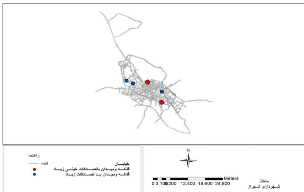
نقشه شماره ۲- توزیع فضایی تصادفات در میدان و فلکه بر حسب تعداد